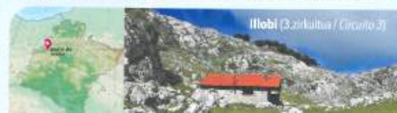
Illobi (3. zirkuitua / Circuito 3)

La mayor parte de la sierra está cubierta por matollar, praderas y bosque, con extensos hayedos, tradicionalmente aprovechados para leña y producción maderera. En las praderas pastan vacas, ovejas, latxas, yeguas y pottokas, una raza equina autóctona. El pastoreo se remonta a la prehistoria, como lo atestiguan la abundancia de dólmenes, siendo una zona megalítica de gran interés. Tierra de mitos y leyendas como la del caballero Teodosio de Goñi: tras cometer parricidio, se refugió en una cueva donde le apareció un dragón y, para matarlo, le ayudó el arcángel San Miguel. En su honor se erigió el santuario románico de San Miguel de Excelsis, impresionante mirador al valle de Sakana y su entorno.