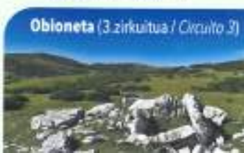
Obioneta (3. zirkuitua / Circuito 3)